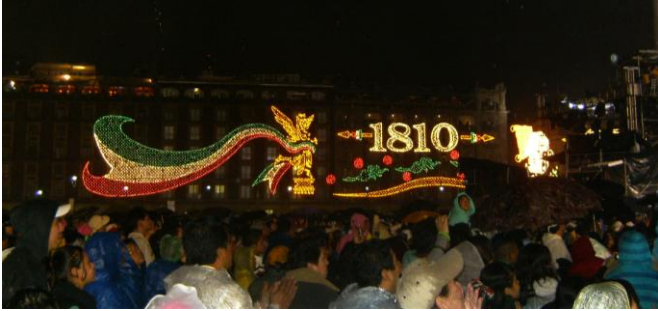
Die ganzen Lichter, WAHNSINN.