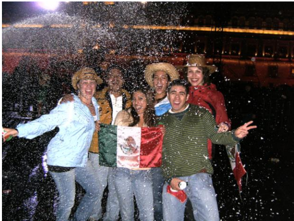
Und natürlich noch mit dem „Sprühzeugs“ 😊